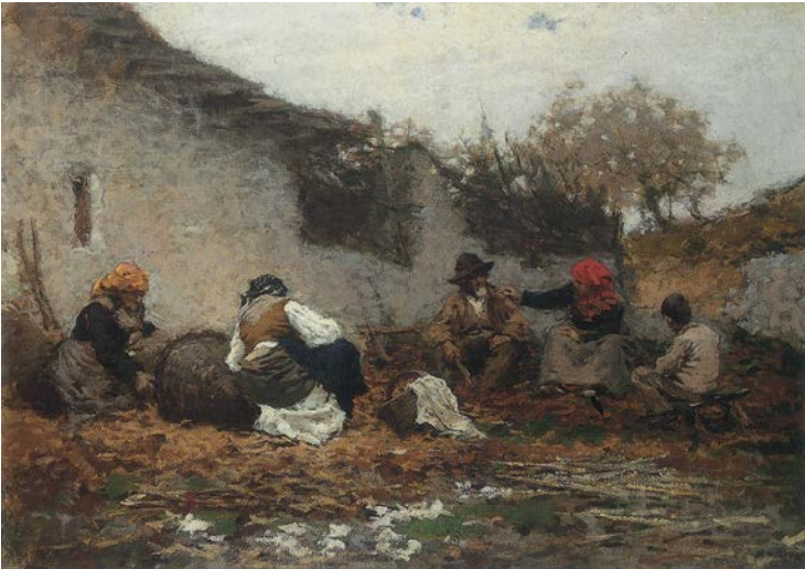
Filippini, Raccolta delle Castagne, 1887.