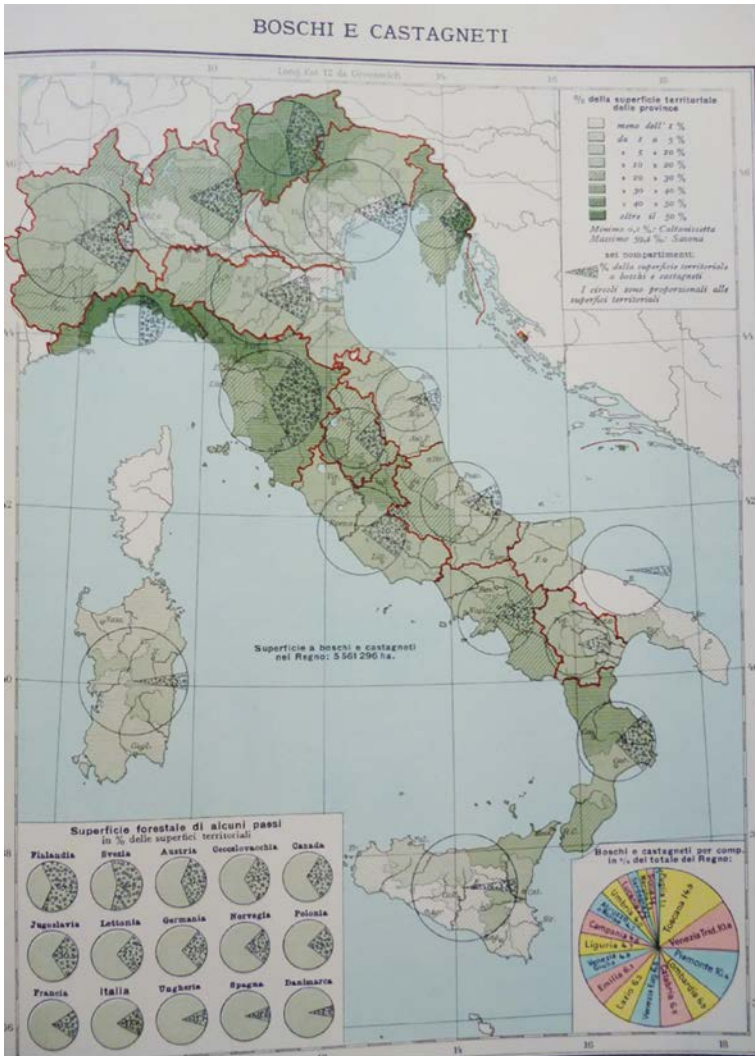
Figura 1. Boschi e castagneti in Italia (1935)