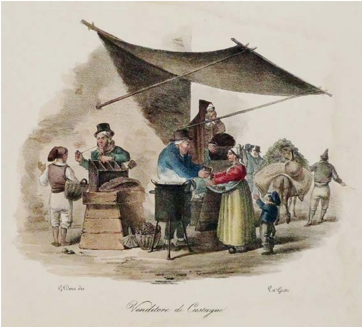
Gatti e Dura, Venditore di castagne, Napoli, 1835 circa.